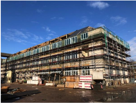
Haus 1 Nach Fenstereinbau

Ausblick Im 1. Quartal 2018 werden die Dacharbeiten im 1. Bauabschnitt beendet. Durch den Einbau der Fenster wird der Rohbau geschlossen. Die Sanitär- und Elektro-Installationsarbeiten beginnen.