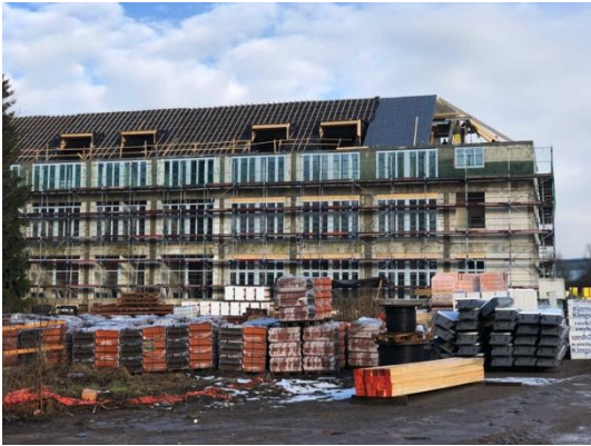
Haus 1 Materiallager