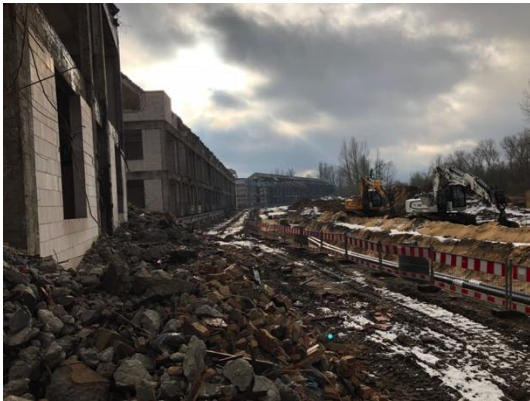
Erschließung Gesamtliegenschaft auf der Rückseite