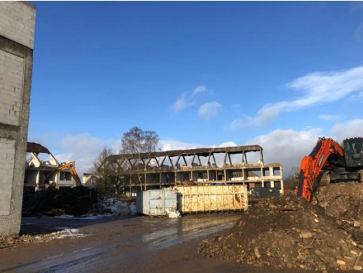
Haus 4 Nach der Entkernung