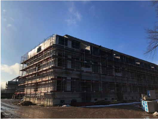
Haus 2 Vorbereitung für den Fenstereinbau