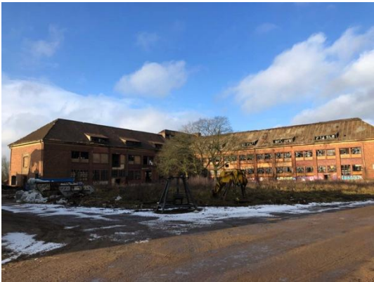
Haus 5 Entkernung in der 50. KW 17 begonnen