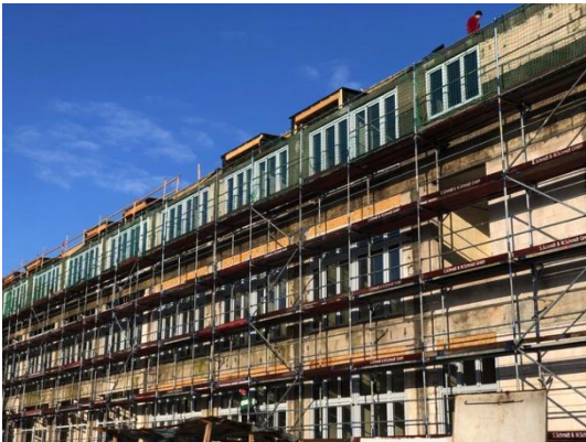
Haus 2 Fenstereinbau