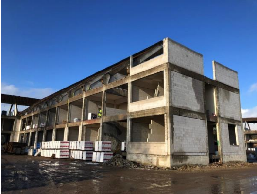
Haus 3 Rohbauarbeiten in vollem Gange