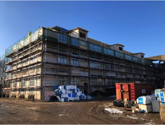
Haus 1 Einbau der Fenster und Arbeiten am Dach

Die Entkernungsarbeiten in den Häusern 3 und 4 sind ebenfalls weitestgehend abgeschlossen. Die Rohbauarbeiten haben auch dort bereits begonnen.