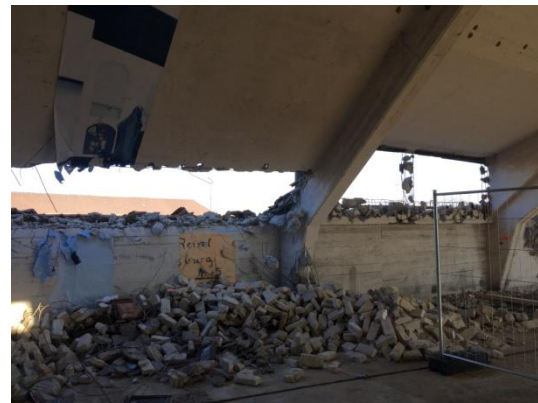
Haus 1 aufgebrochene Splitterschutzdecken

Die Entkernungsmaßnahmen sind im Haus 1 abgeschlossen und auch im Haus 2 weitestgehend beendet. Die Außenwände wurden für die neue Pfosten-Riegelkonstruktion der Fenster- und Terrassenzugänge entfernt. Die Betonpfeiler sind freigelegt und werden später dann mit dem WDVS verkleidet. Im Haus 2 wird mit der Erstellung der neuen Wohnungstrennwände begonnen.