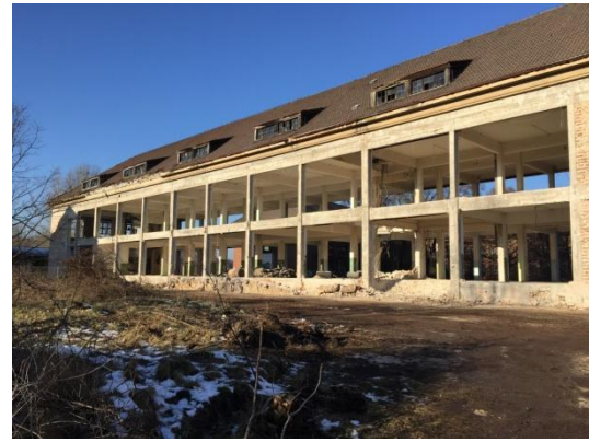
Haus 2 Entkernungsarbeiten

Wichtiger Hinweis zur Baustellenbegehung: Aus Versicherungs-, und Haftungsgründen ist eine Begehung der Baustelle ohne vorherige Anmeldung, ohne entsprechender Sicherheitskleidung sowie der Begleitung eines Mitarbeiters von uns vor Ort, strengstens untersagt. Um einen sicheren und reibungslosen Bauablauf zu gewährleisten, ist es daher zwingend erforderlich, uns sämtliche Vor-Ort-Termine mind. 48 Stunden im Vorfeld anzuzeigen, damit wir die Koordination übernehmen können. Die Bauleitung ist angewiesen, unangemeldete Gäste der Baustelle zu verweisen!