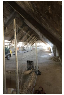
Haus 2 Entkernungsarbeiten

Die Entkernungsmaßnahmen sind im Haus 1 abgeschlossen und auch im Haus 2 weitestgehend beendet. Die Außenwände wurden für die neue Pfosten-Riegelkonstruktion der Fenster- und Terrassenzugänge entfernt. Die Betonpfeiler sind freigelegt und werden später dann mit dem WDVS verkleidet. Im Haus 2 wird mit der Erstellung der neuen Wohnungstrennwände begonnen.